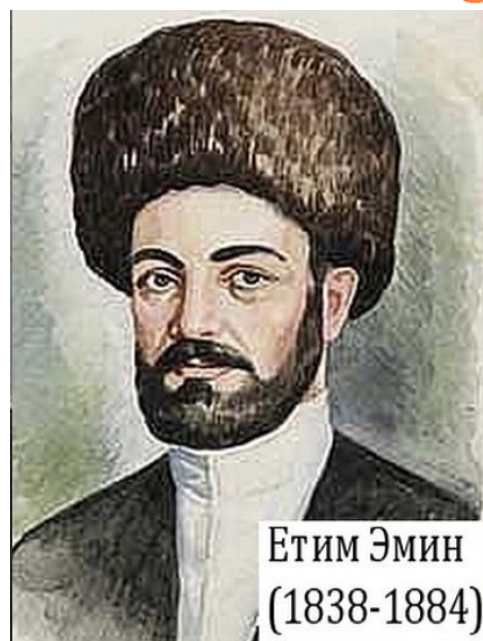
Етим Эмин (1838-1884)